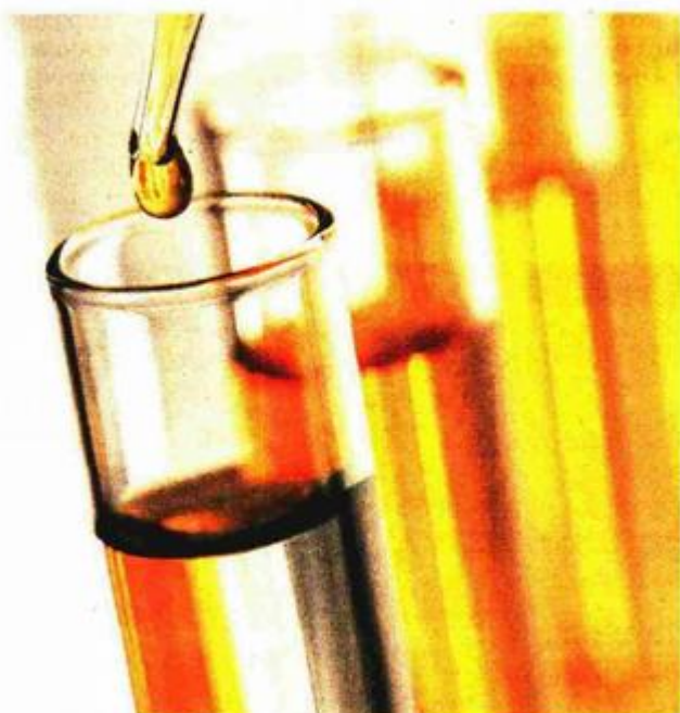
Paniraju kredit od 21 milijun kuna