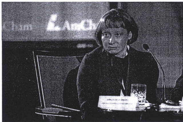
SNIMIO SAŠA ČETKOVIĆ

"Tada smo ocijenili da Mol tim ugovorom preuzima kontrolu nad Inom bez obzira na činjenicu da ne posjeduje većinski paket dionica", kazala je i dodala kako je