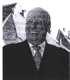
Kralj Harald V.

Iako su norveško-hrvatski odnosi izvrsni, postoji još prostora za gospodarsku suradnju na obnovljivim izvorima energije, obrambenoj opremi i novim tehnologijama. Istaknuto je to prvog dana posjeta norveškoga kralja Harald V. sa suprugom Sonjom Hrvatskoj. S norveškim kraljem je došla i delegacija 30-ak norveških tvrtki i institucija koji su na seminarima organiziranim u četvrtak s domaćim predstavnicima razmjenjivali